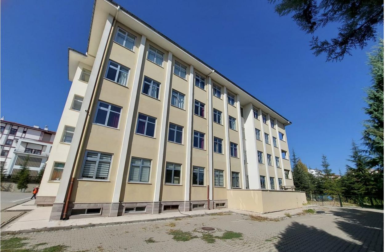
Şekil 4. Beypazarı Evliya Çelebi Mesleki ve Teknik Anadolu Lisesi Dış Görünüş-2